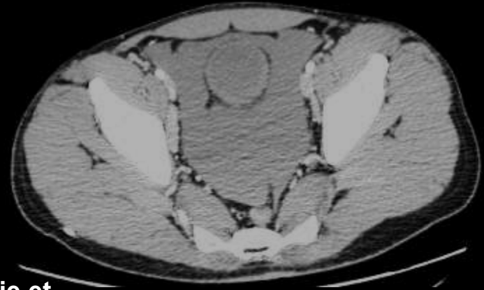
Splénomégalie et rupture de rate avec hémopéritoine